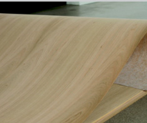
Das Furnier lässt sich sogar auf 360°-Rundungen problemlos aufleimen.