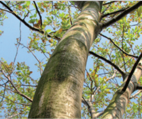
EASiWOOD ist ein geschmeidiges Furnier, auf Wunsch aus zertifiziertem Holz.