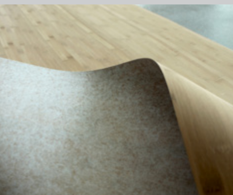
Die Vliesrückseite wirkt zusätzlich stabilisierend.