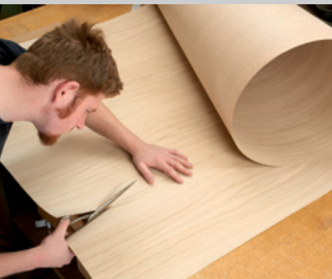
EASiWOOD ist einfach zu verarbeiten. Eine Verarbeitungsanleitung finden Sie in unserem Shop.